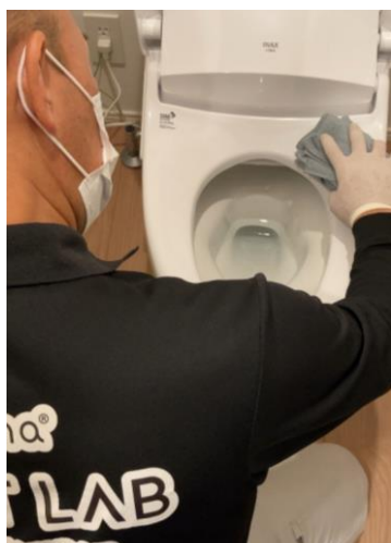
トイレの「レコナ アクアフレッシュ アクア G 抗菌プラス」作業の様子